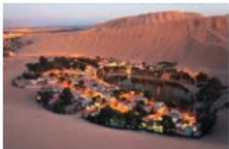
Laguna de Huacachina Huacachina Lagoon

Jr. Moquegua 810, piso 3 Telf / Phone: (053) 475027