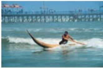
Balneario de Huanchaco Huanchaco Beach