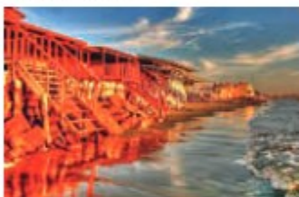
Balneario de Colán Colán Beach

Calle Lima 418, Chincha Alta Telf / Phone: (056) 655040