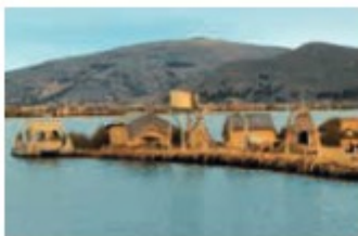
Lago Titicaca Titicaca Lake

Av. El Sol 616, oficina 301 Telf / Phone: (084) 252624