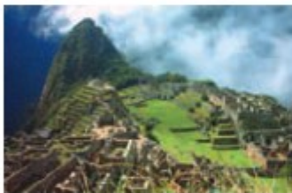
Santuario de Machu Picchu Machu Picchu Sanctuary

Av. Ramón Mujica 108, dpto. 202, urb. El Chipe (costado del grifo Mega) Telf / Phone: (073) 604679 - 619400