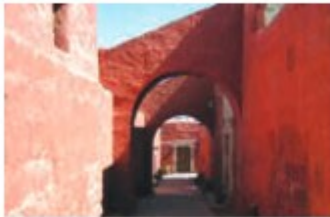
Convento de Santa Catalina Santa Catalina Monastery

Calle Tacna 293 Telf / Phone: (074) 226627